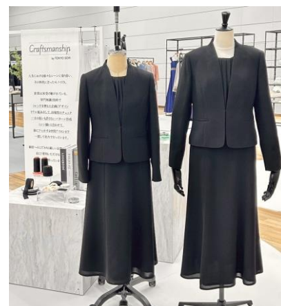
▲左：小柄用プチサイズ 右：通常サイズ