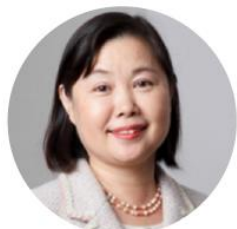
日本女子大学名誉教授 大塚美智子

普段の洋服とドレスとではサイズ表記が乖離している…というお悩みを解決するために、 長年衣服設計のための体型研究をしてきた日本女子大学の教授と共にプラスサイズのリアルな体型特徴をとらえた 3D アバターを作成し、4L サイズをベースにプラスサイズ体型にフィットするオリジナルのサイズを作成。